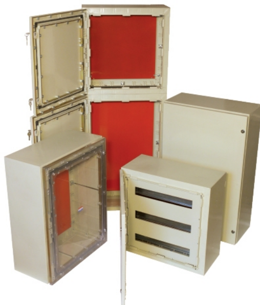
Gabinets de Múltiple Prestación